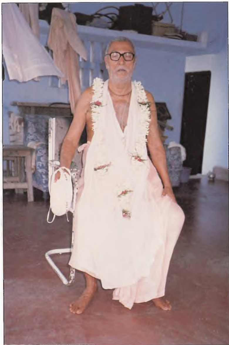
ঔ বিষ্ণুপাদ শ্রীশ্রীল ভক্তিরক্ষক শ্রীধর দেবগোস্বামী মহারাজ Om Viṣṇupād Śrī Śrīla Bhakti Rakṣak Śrīdhar Dev-Goswāmi Mahārāj