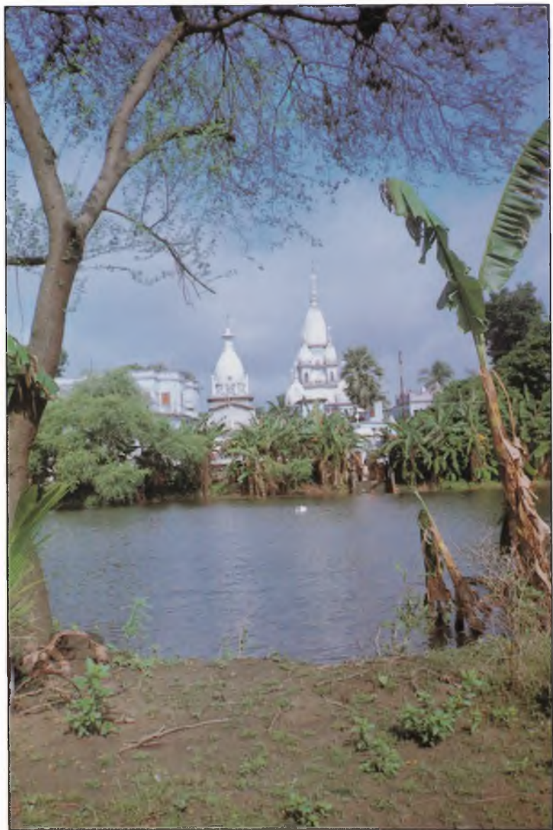
নবদ্বীপ শ্রীচৈতন্য-সারস্বত মঠ Nabadwip Śrī Chaitanya Sāraswat Maṭh