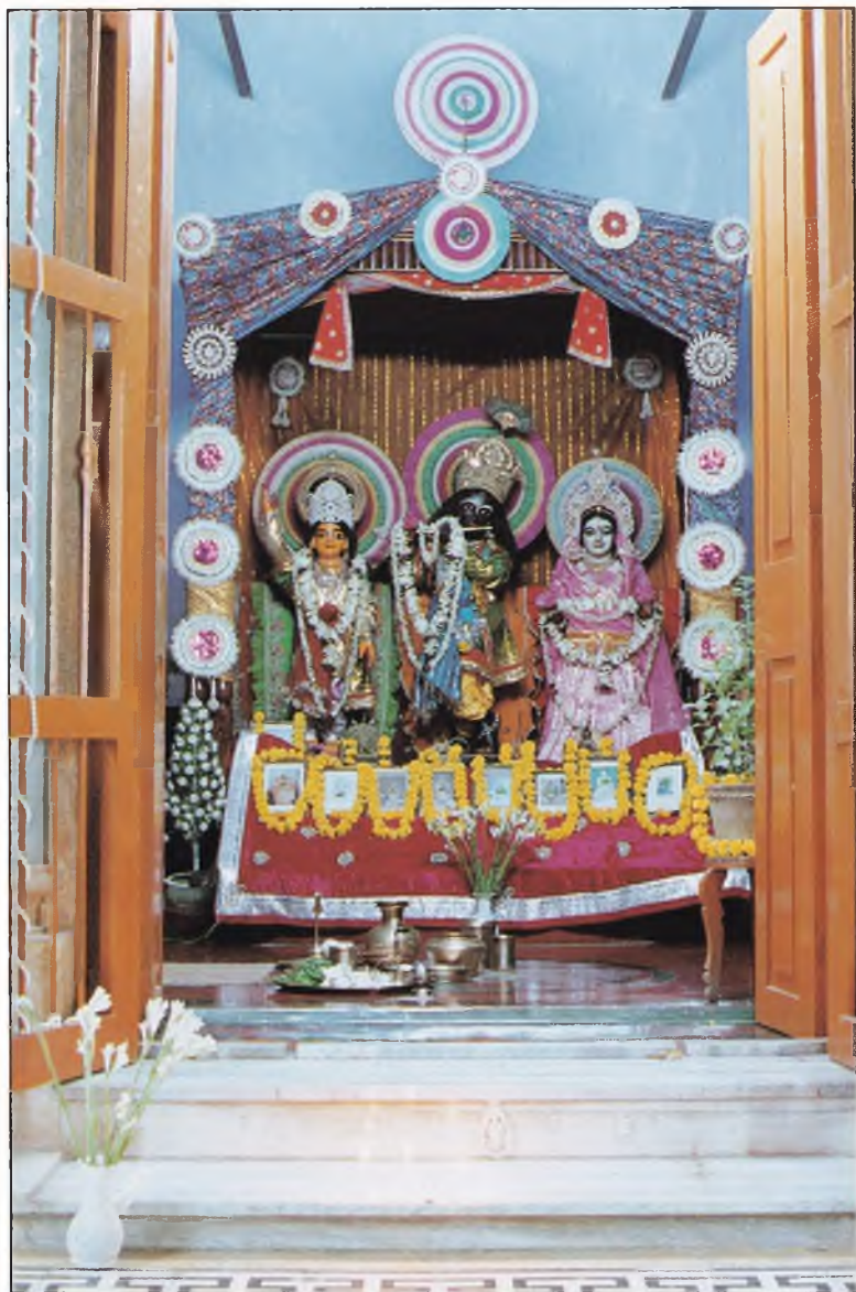
শ্রীশ্রীগুরু-গৌরাঙ্গ-গান্ধর্ব্বা-গোবিন্দসুন্দরজীউ Śrī Śrī Guru-Gaurāṅga-Gāṅdhārvā-Govindasundarjīu